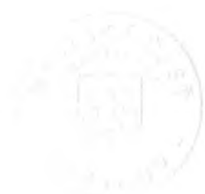
Mgr. Ing. Dušan Pekár starosta

▪ pozemku registra „C“ , parcela č. 15278/46 – zastavané plochy a nádvoria o výmere 18 m 2 , evidovaného v katastri nehnuteľností na liste vlastníctva č. 1201, na ktorom je umiestnená stavba – garáž, evidovaná v KN na liste vlastníctva č. 815, bola v súlade s ustanovením § 5a zákona NR SR č. 211/2000 Z. z. o slobodnom prístupe k informáciám a o zmene a doplnení niektorých zákonov v znení neskorších predpisov, zverejnená na webovom sídle mestskej časti Bratislava-Ružinov dňa 05.10.2017.