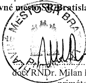
doc. RNDr. Milan Ftáčnik, CSc. primátor